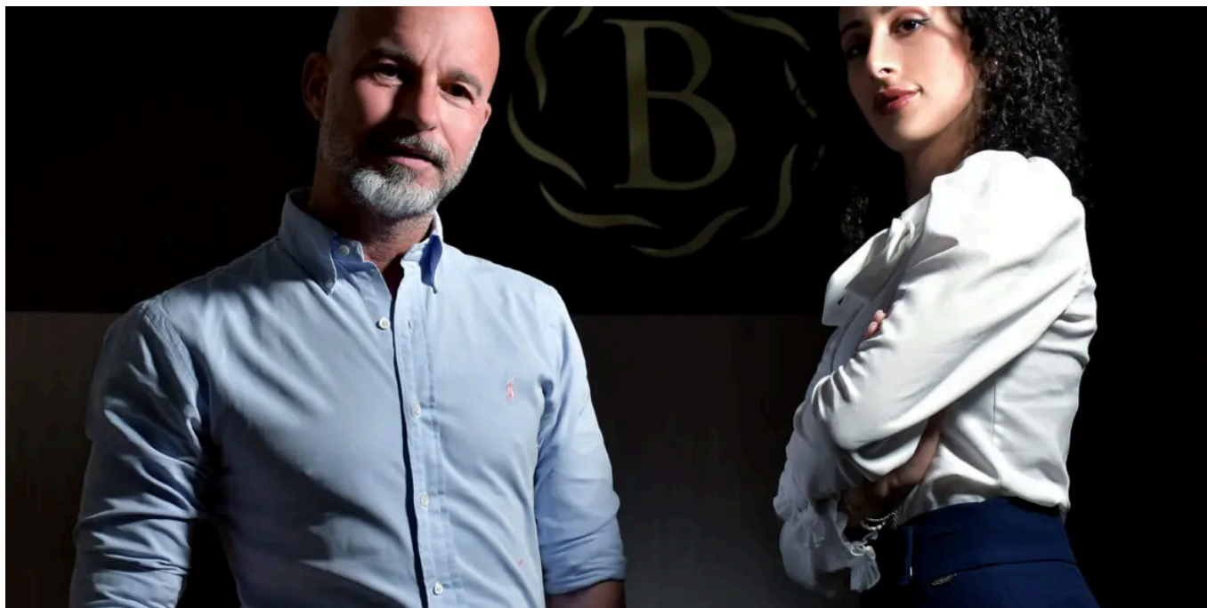
Studi Legali degli avv. Biondi e Esposito

Il mercato internazionale cambia in maniera repentina e presenta sempre nuove possibilità. Negli Emirati Arabi, e in particolare a Dubai, non ci sono soltanto agevolazioni fiscali ma significative opportunità di crescita anche per i piccoli e medi imprenditori che hanno interesse ad internazionalizzare qui la loro attività oppure intendono rilocarsi completamente negli Emirati Arabi.